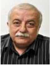
Yves Contreras Président depuis avril 2008