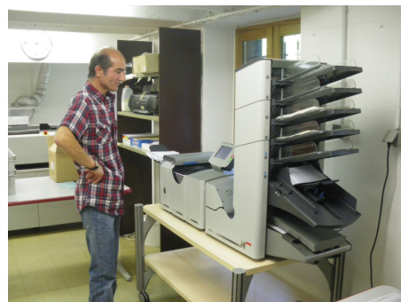
Machine à mettre sous pli